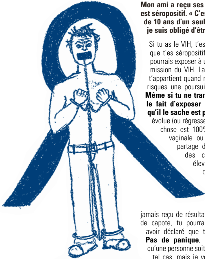
Français en prisonnier.

Mon ami a reçu ses résultats de dépistage. Il est séropositif. « C'est comme si j'avais vieilli de 10 ans d'un seul coup... J'ai pu le choix, je suis obligé d'être responsable... »